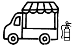
消火器設置位置の例